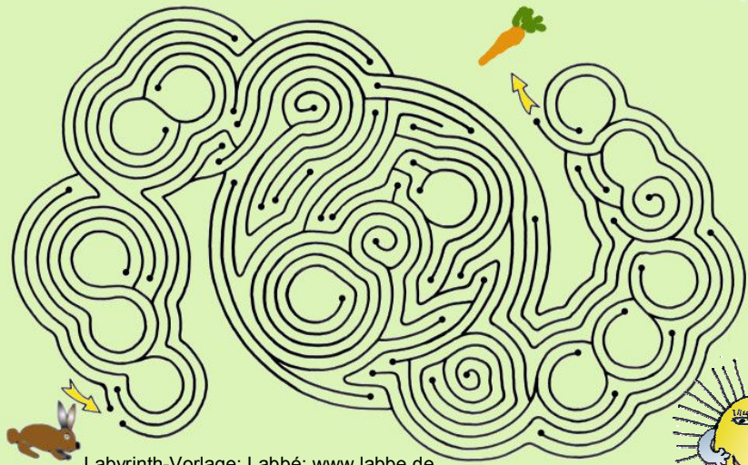
Labyrinth-Vorlage: Labbé: www.labbe.de

Lösungen Quiz: Elefanten, Papaya, Mexiko